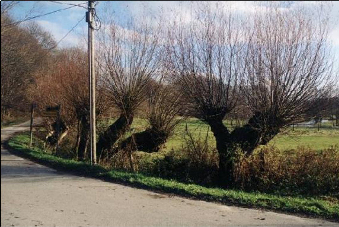
Abb. 1: Fundort 4 (Stepenitzbrücke bei Roxin, siehe Tab. 1). Auf diesen Kopfweiden konnten zwölf Schneckenarten, darunter alle in Abb. 2 abgebildeten, nachgewiesen werden.